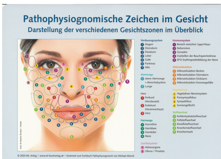
Reflexzonen unserer Organe am Gesicht

Dafür reichen schon wenige Minuten und die Anwendung kann bei Bedarf auch mehrmals am Tag erfolgen.