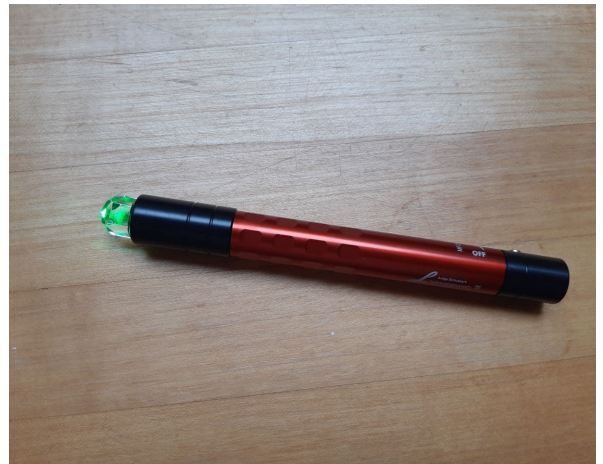
MonoLux KristallPEN mit einer Spitze aus Bergkristall